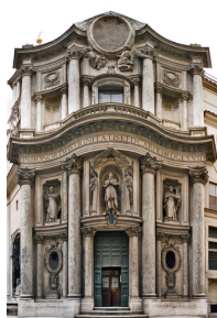
La fachada de San Carlos de las Cuatro Fuentes, de Borromini, es una muestra de los recursos arquitectónicos del Barroco.

Francesco Borromini (1599-1667), rival de Bernini, autor de pequeñas iglesias de formas curvas y fachadas espectaculares, como la de San Carlos de las Cuatro Fuentes (1638-1641), con planta en forma de rombo; la Iglesia de Santa Inés; Oratorio de San Felipe de Neri. Sus construcciones están provistas de curvas y movimiento, cúpulas ovaladas, fachadas cóncavas y convexas, esquema oval frente a la linealidad renacentista, racionalidad y geometría modular, cornisa serpenteante, fachadas donde se esculpen nichos, orden gigante y monumentalismo, dinamismo espacial, uso de la luz o el claroscuro, incorporación de la escultura, materiales simples y técnica del trampantojo (juega con la perspectiva y da sensaciones al ojo de elementos o formas inexistentes, como se hizo en el Palacio Spada, donde el pasillo es más corto de lo que pensamos).